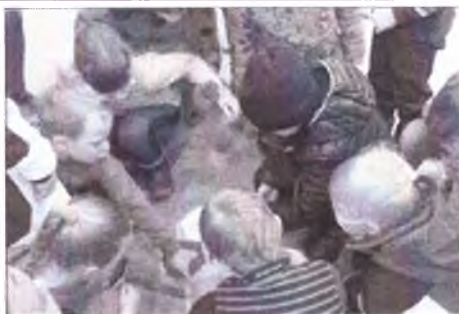
Третья беседа по адаптивным роликам и командным играм Третья беседа по адаптивным роликам и командным играм

Информация, указанная Вами в данном разделе отчета, будет доступна для посетителей сайта оценка.гранты.рф (в том числе для представителей СМИ).