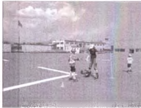
занятия Шуликов Слава