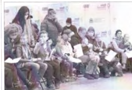
Третья беседа по адаптивным роликам и командным играм 4 Третья беседа по адаптивным роликам и командным играм

Мероприятие: Проведение занятий с лицами с ОВЗ по адаптивному роллер-спорту