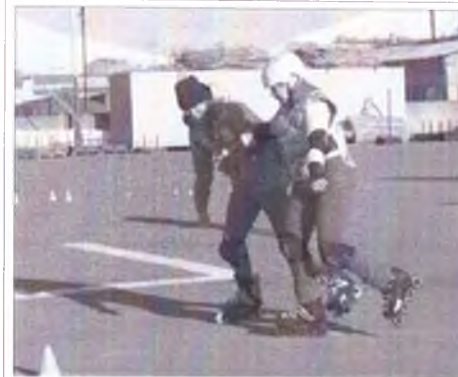
Пенсионеры на старт Пенсионеры на старт