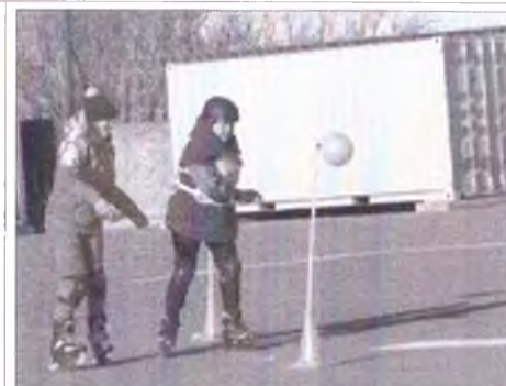
Пенсионеры на старт Пенсионеры на старт