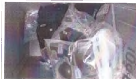
фото груза 3 фото груза (ролики, защита, шлемы, конусы и тп)