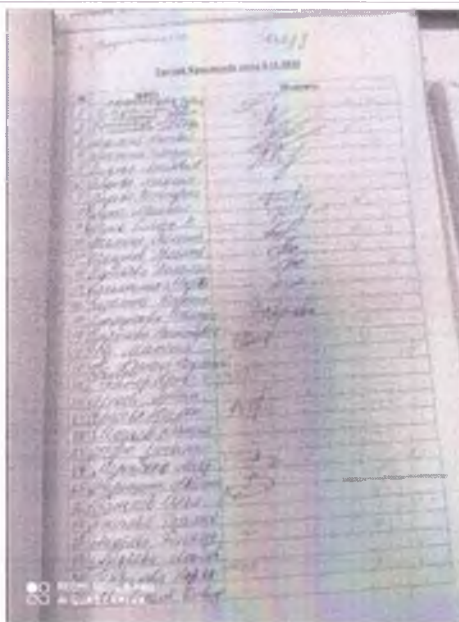
список участников 1 список участников 1