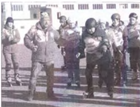
Пенсионеры на старт Пенсионеры на старт