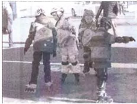
Участники готовятся к старту заезд