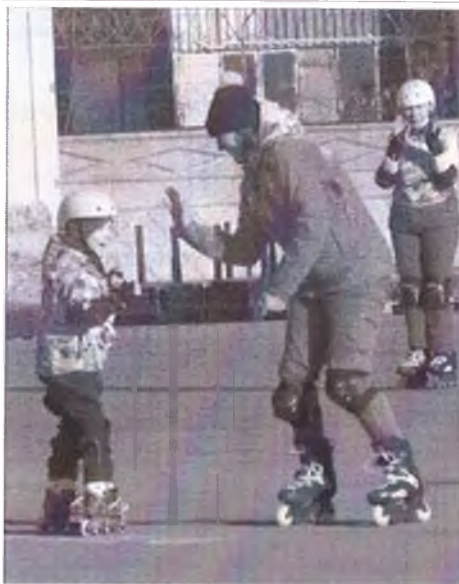
Молодец, дай пять! Молодец, дай пять!