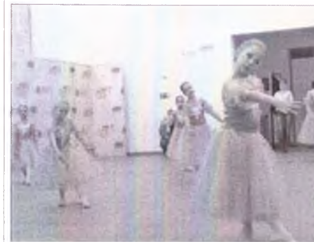
выступление танцевального коллектива выступление танцевального коллектива