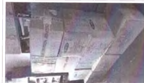
фото груза 1 фото груза (ролики, защита, шлемы, конусы и тп)