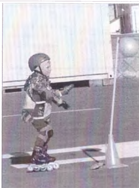
Участник заезда Участник заезда