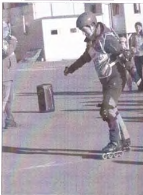
Пенсионеры на старт Пенсионеры на старт