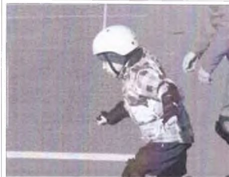
Участник заезда Участник заезда