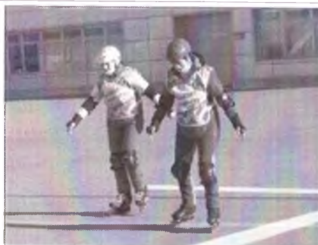
Пенсионеры на старт Пенсионеры на старт

Мероприятие: Проведение Третьего Крылатого заезда по итогам роликового сезона с привлечением участников проекта