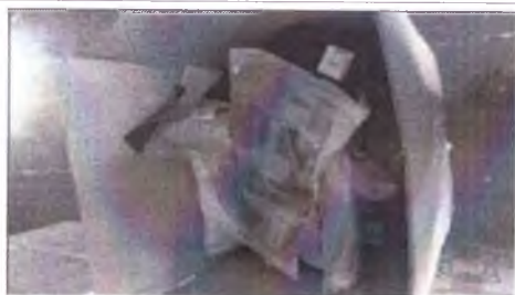
фото груза 2 фото груза (ролики, защита, шлемы, конусы и тп)