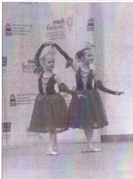
выступление танцевального коллектива выступление танцевального коллектива