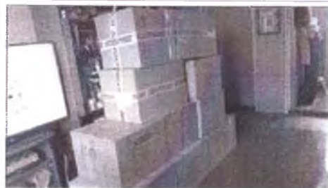
фото груза инвентарь, оборудование фото груза (ролики, защита, шлемы, конусы и тп)

Информация, указанная Вами в данном разделе отчета, будет доступна для посетителей сайта оценка.гранты.рф (в том числе для представителей СМИ).