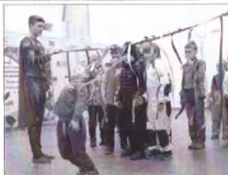
Третья беседа по адаптивным роликам и командным играм 2 Третья беседа по адаптивным роликам и командным играм