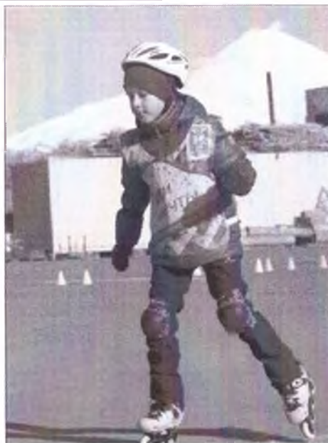
Участник заезда Участник заезда