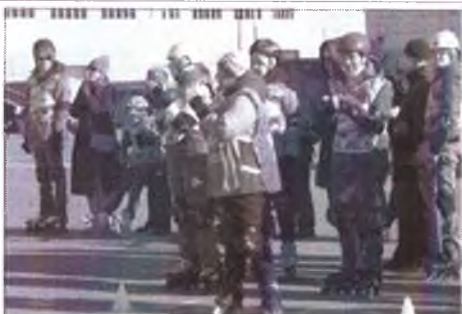
болельщики группа поддержки