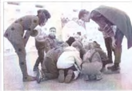
Третья беседа по адаптивным роликам и командным играм 1 Третья беседа по адаптивным роликам и командным играм