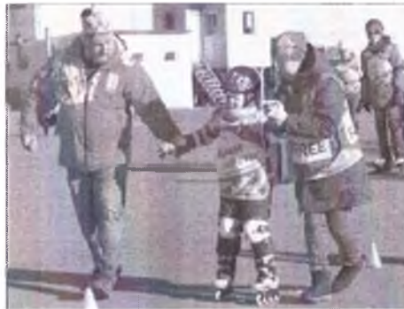
Участник заезда 1