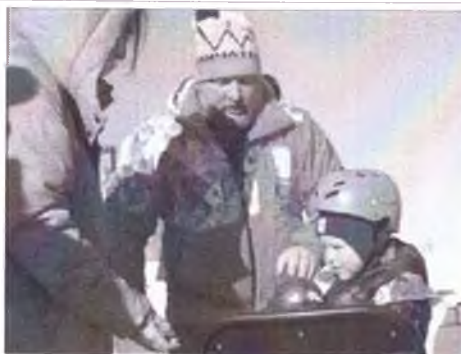
не хочу отдавать мяч Участник заезда