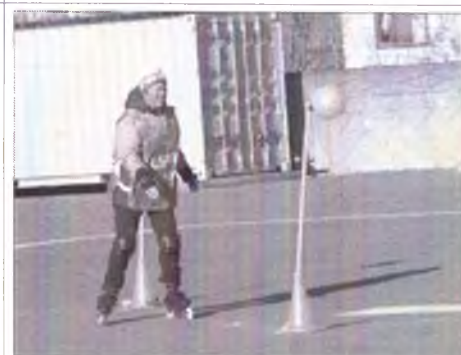
Пенсионеры на старт Пенсионеры на старт