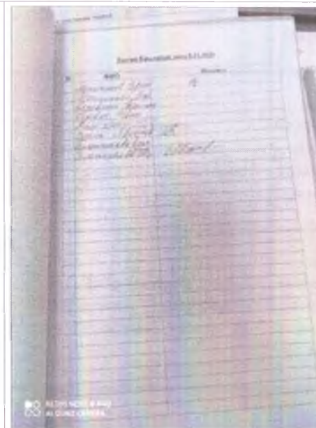
список участников 2 список участников 2