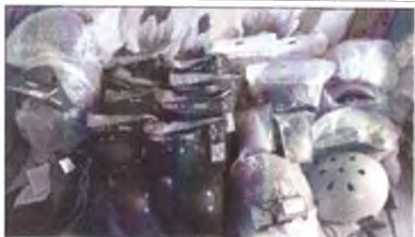
фото груза 4 фото груза (ролики, защита, шлемы, конусы и тп)