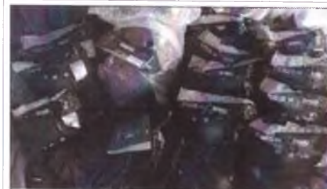
фото груза 5 фото груза (ролики, защита, шлемы, конусы и тп)