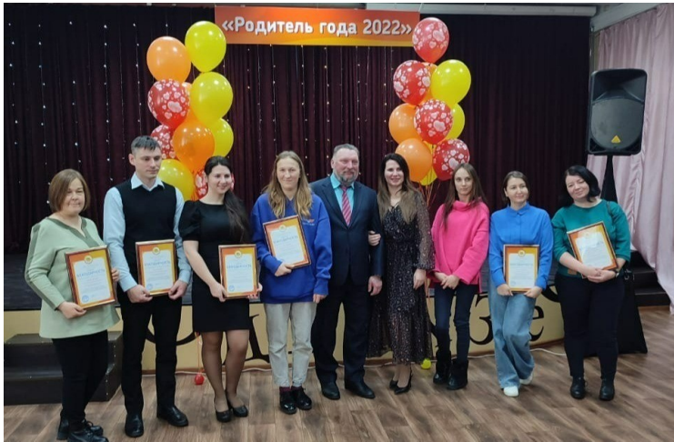
Мероприятие, посвящённое вручению премии «Родитель года 2022»

Мы верим, что каждый человек достоин активной жизни, и наша миссия состоит в том, чтобы сделать это возможным для людей с ограниченными возможностями здоровья.